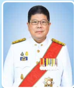
นายธานี ทองภักดี ปลัดกระทรวงการต่างประเทศ