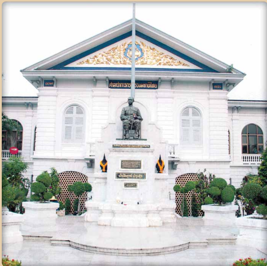
กระทรวงมหาดไทย Ministry of Interior