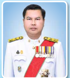
นายสุภัทร จำปาทอง ปลัดกระทรวงศึกษาธิการ