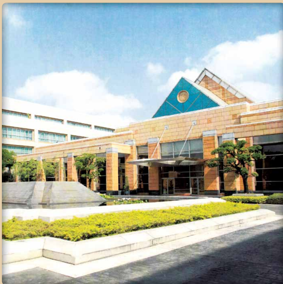
กระทรวงการต่างประเทศ Ministry of Foreign Affairs