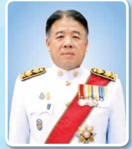
นายโชติ ทรายชู ปลัดกระทรวงการท่องเที่ยวและกีฬา