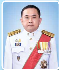
ศาสตราจารย์พิเศษวิชญ์ วิศิษฐ์สรอรรถ ปลัดกระทรวงยุติธรรม