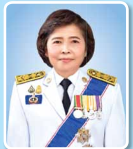
นางพัชรี อาระยะกุล ปลัดกระทรวงการพัฒนาสังคม และความมั่นคงของมนุษย์