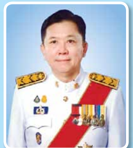
นายจตุพร บุรุษพัฒน์ ปลัดกระทรวงทรัพยากรธรรมชาติและ สิ่งแวดล้อม