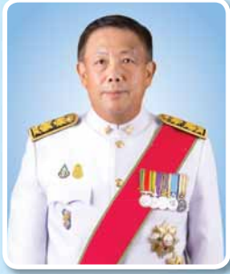
นายแพทย์เกียรติภูมิ วงศ์รจิต ปลัดกระทรวงสาธารณสุข