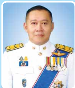
นายชยธรรม์ พรหมศร ปลัดกระทรวงคมนาคม