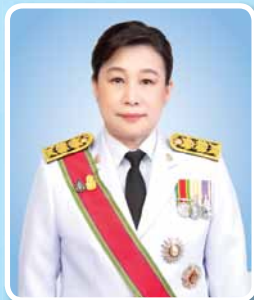
นายอุพา ทวีวัฒนกิจบวร ปลัดกระทรวงวัฒนธรรม