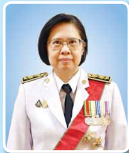
นางสาวอ้อนฟ้า เวชชาชีวะ เลขาธิการ ก.พ.ร.