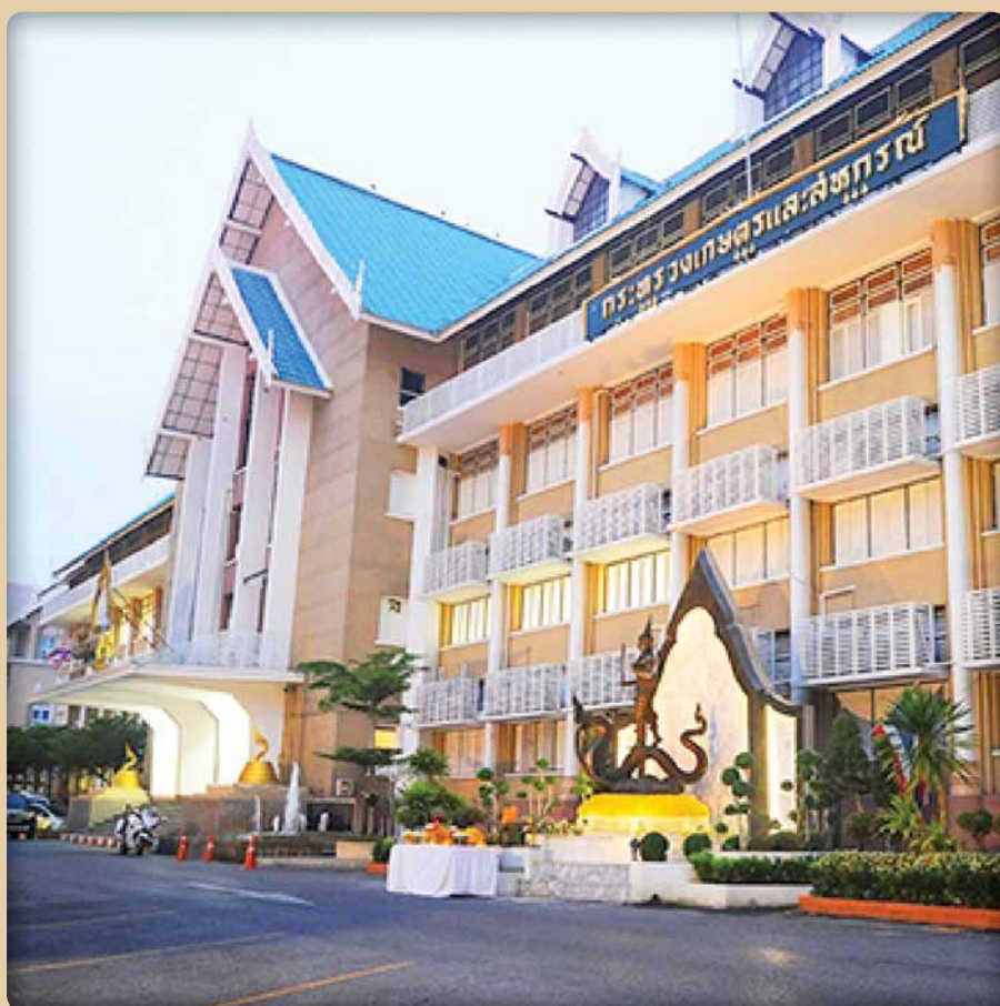
กระทรวงเกษตรและสหกรณ์ Ministry of Agriculture and Cooperatives