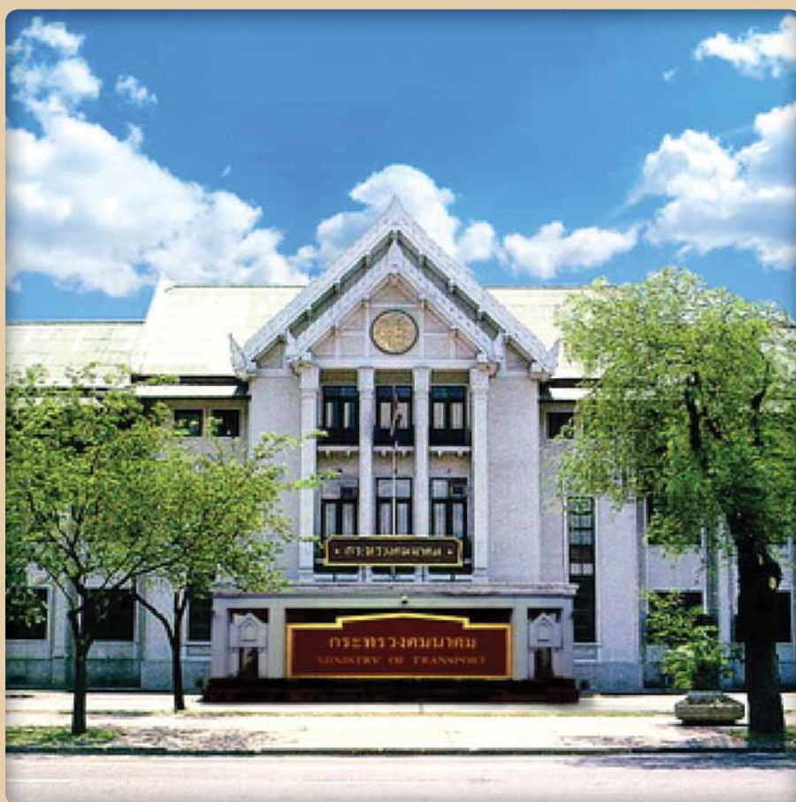
กระทรวงคมนาคม Ministry of Transport