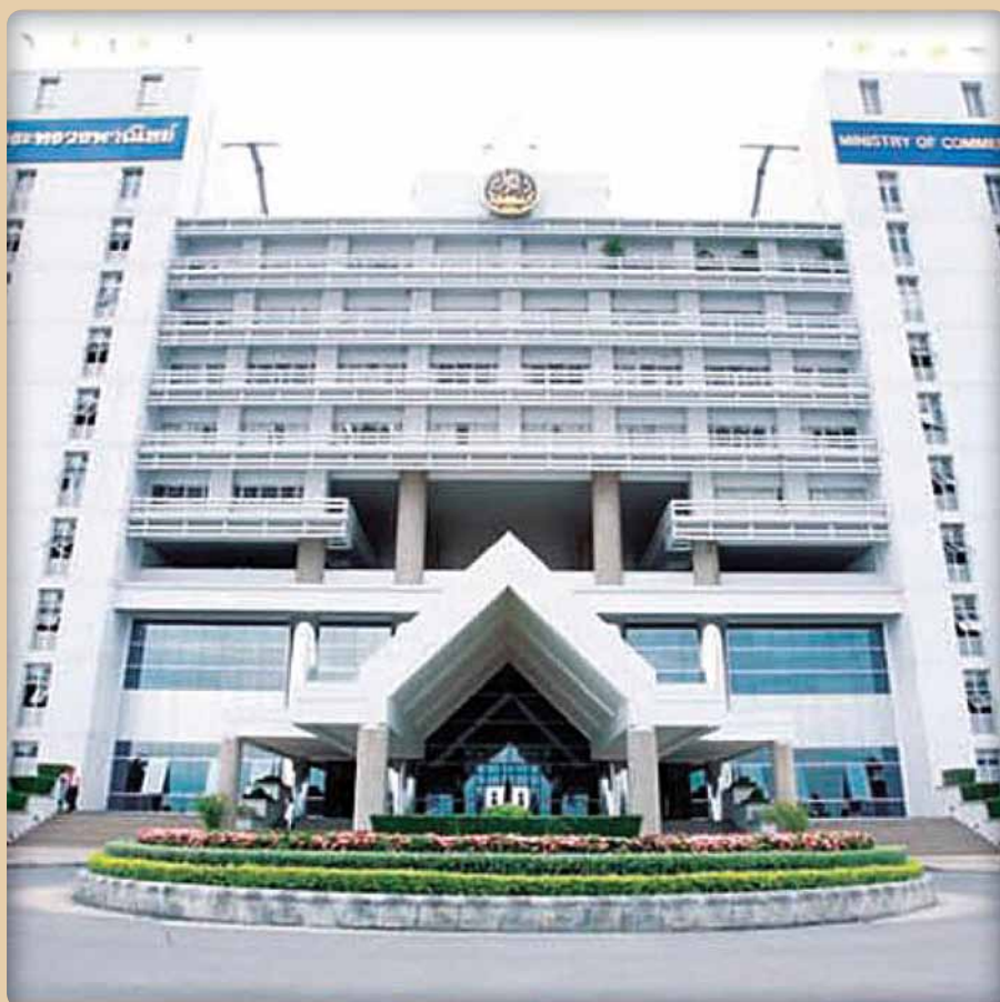
กระทรวงพาณิชย์ Ministry of Commerce