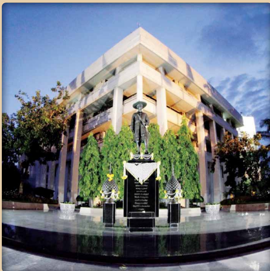
กระทรวงสาธารณสุข Ministry of Public Health