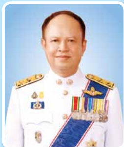
นายทองเปลว กองจันทร์ ปลัดกระทรวงเกษตรและสหกรณ์