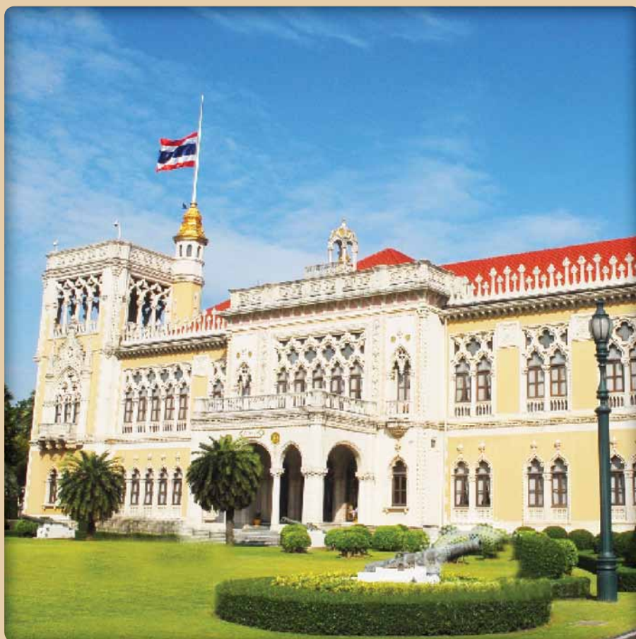
สำนักนายกรัฐมนตรี Office of The Prime Minister