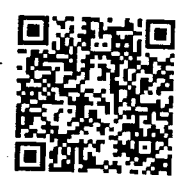
เอกสารแนบท้าย