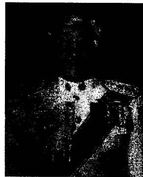
พลตำรวจโท ปัญญา เอ่งฉ้วน