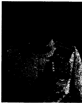
พลตำรวจเอก ชัยยะ ศิริอำพันธ์กุล