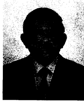
พลตำรวจโท เฉลิมพันธ์ อจลบุญ