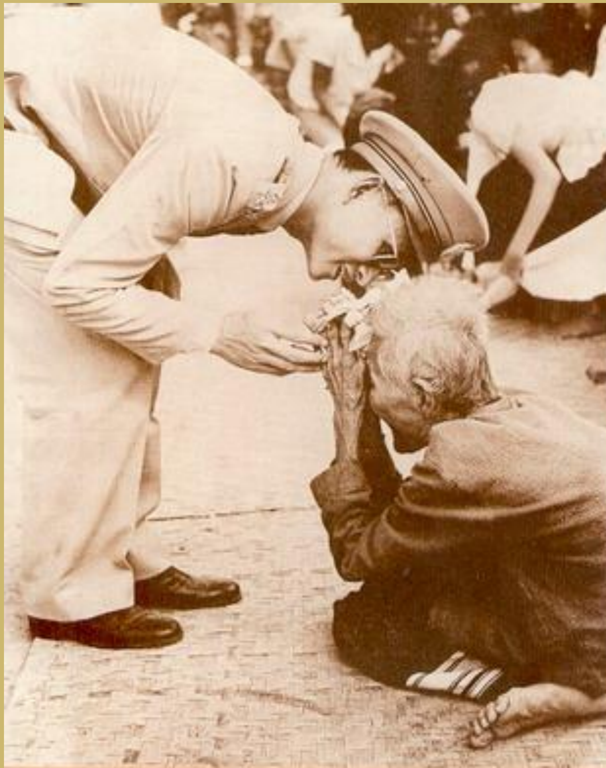
นวมินทรราชธิราช THE GREAT KING OF THAILAND